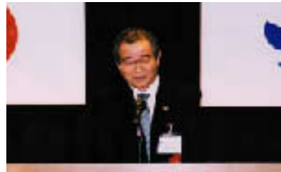
▲来賓 伊藤市長のご祝辞