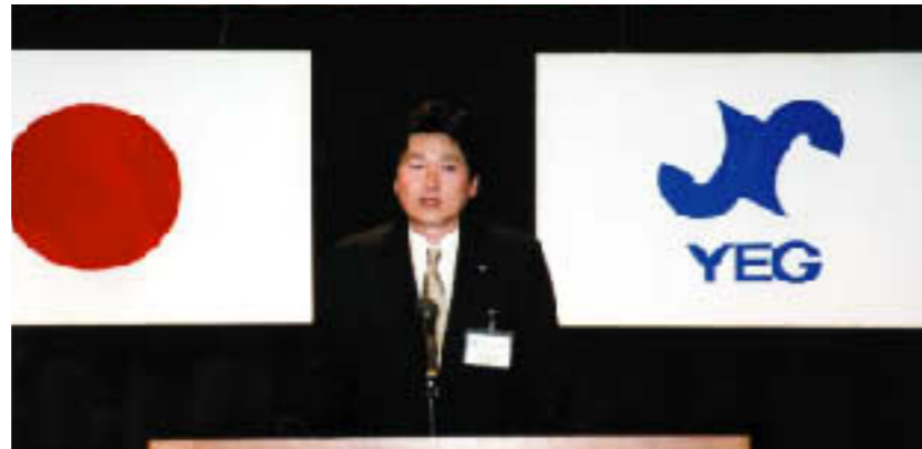
▲桧垣会長のあいさつ